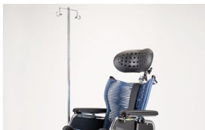
933 Asta portaflebo