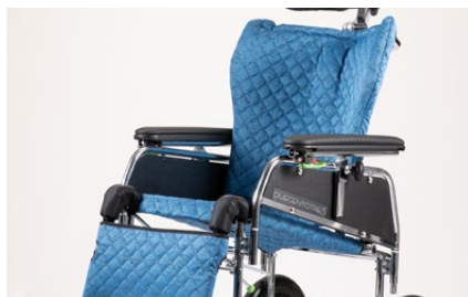
836 Tappezzeria schienale, sedile e poggiatesta Asportabile per il lavaggio.